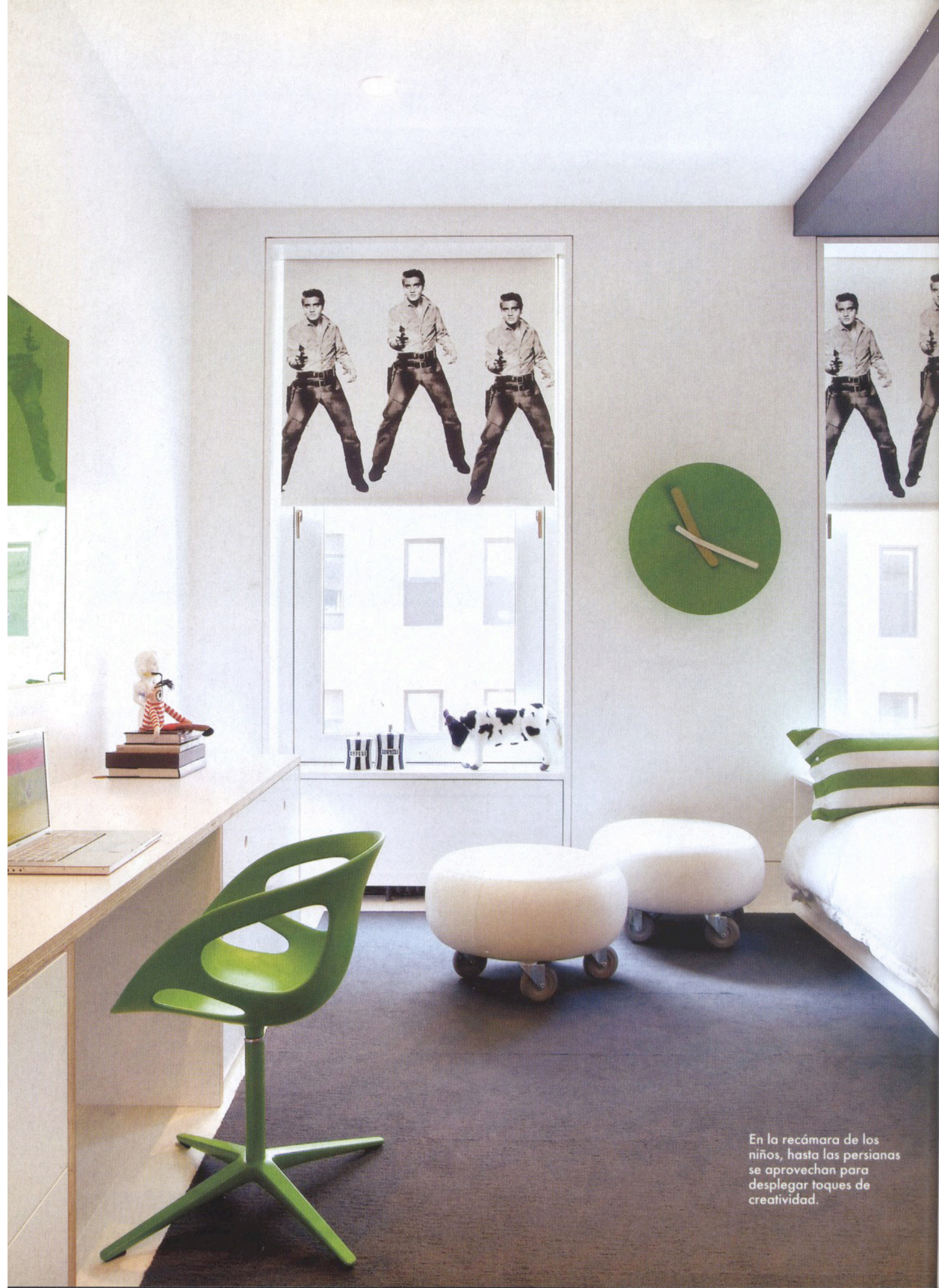
En la recámara de los niños, hasta las persianas se aprovechan para desplegar toques de creatividad.