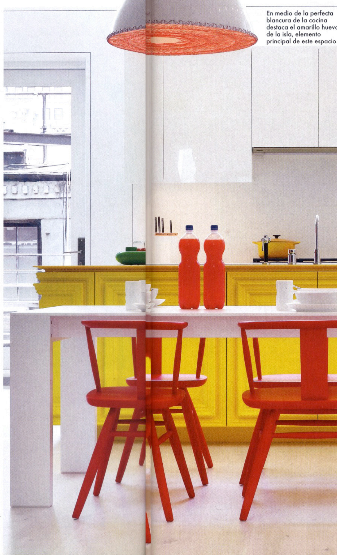
En medio de la perfecta blancura de la cocina destaca el amarillo huevo de la isla, elemento principal de este espacio.