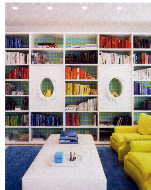
La inspiración para la oficina de la propietaria surgió de una fotografía de un perico amarillo y azul que vio en una revista. La decoradora no sólo aplicó el colorido del pájaro a la habitación; además, encontró una enorme lámpara con plumas color cobalto.