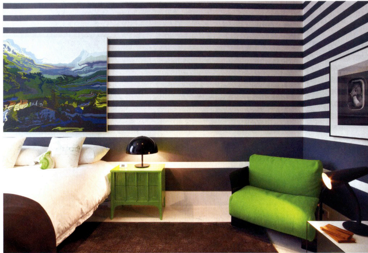
Las reglas se hicieron para romperse es el mensaje que nos transmite esta habitación en la que se han colgado cuadros sobre un muro a rayas