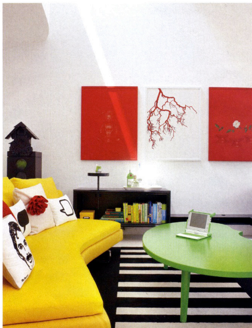
Aunque la consigna era crear un espacio refinado lleno de detalles creativos, en ningún momento se hizo a un lado el aspecto práctico, consideración que no se puede pasar por alto cuando se diseña una vivienda familiar en la que habitan niños pequeños.