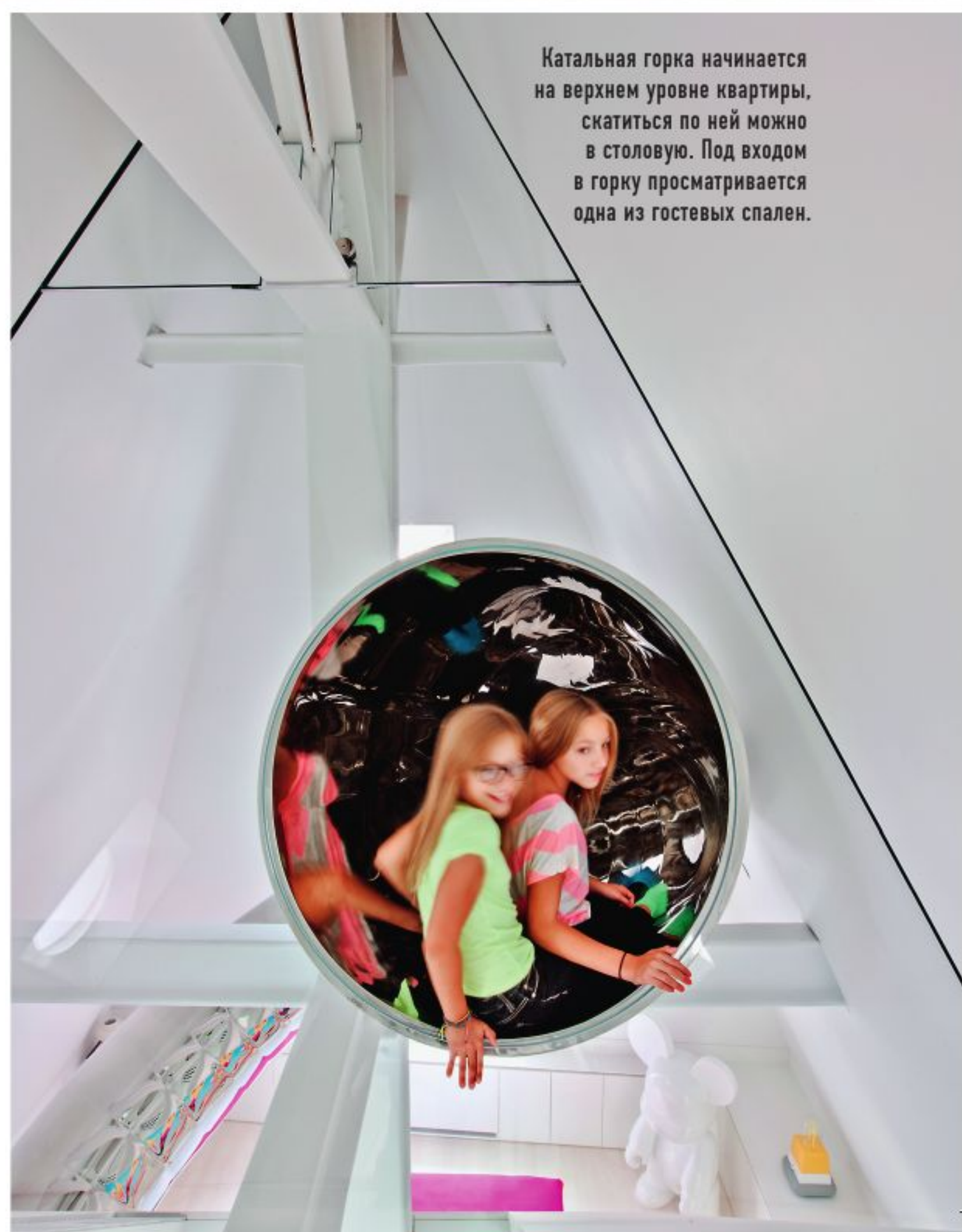
Катальная горка начинается на верхнем уровне квартиры, скатиться по ней можно в столовую. Под входом в горку просматривается одна из гостевых спален.