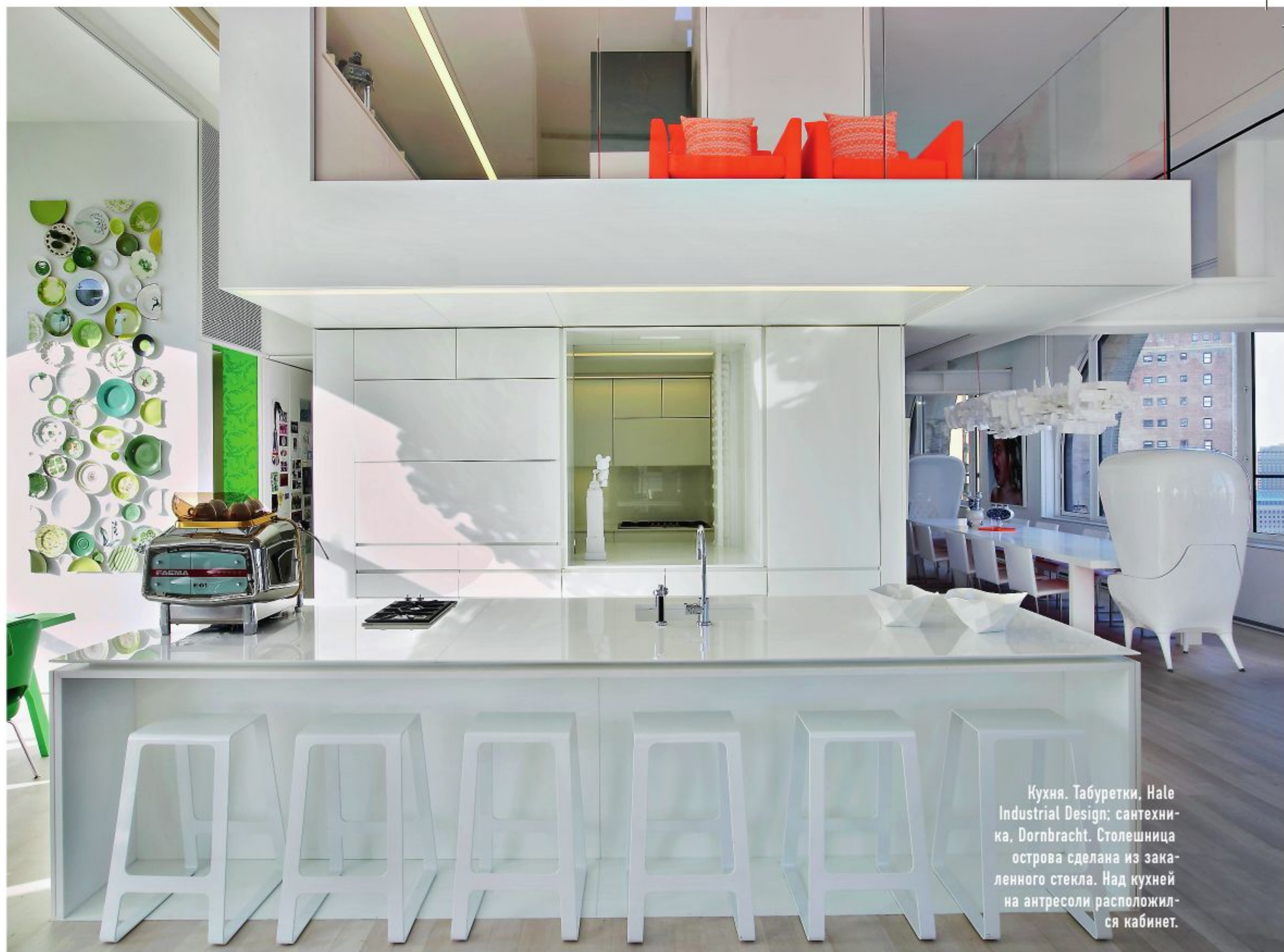
Кухня. Табуретки, Hale Industrial Design; сантехника, Dornbracht. Столешница острова сделана из закаленного стекла. Над кухней на антресоли расположен кабинет.