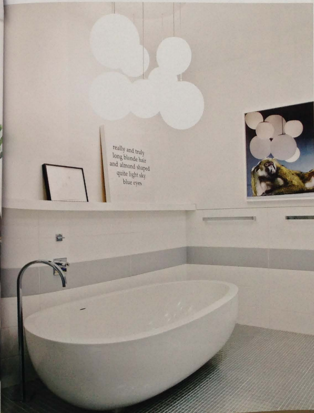
Chaise conçue par Hiromichi Konno. Ottomanes recouvertes de vinyle. Une image d'Andy Warhol apparaît sur les stores en coton des fenêtres.

son équipe ont installée sur le mur. Dans la chambre à coucher et la salle de bains principale, le designer a préféré utiliser des tons plus neutres de blancs et de gris. Pour ajouter une touche d'humour, elle a choisi des rideaux en soie rayés rose vif. À l'étage des enfants, les murs des salles de jeux possèdent une double rayure rouge de circuit de voitures. Les salles de bains épurées sont équipées de robinets vert vif et de carrelage imprimé d'images de brins de pelouse. Si vous dites à Ghislaine Viñas et à son équipe que la maison qu'ils ont créée fait sourire les gens et les rend heureux, ils vous diront que leur pari est réussi.